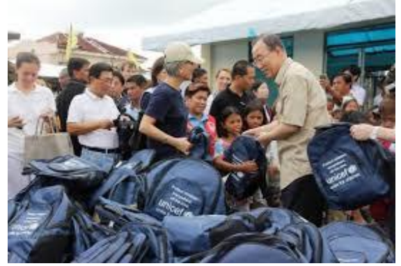
Birleşmiş Milletler Sekreteri General Ban-Ki Moon