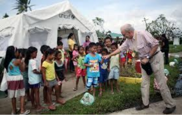
UNICEF Genel Direktörü Anthony Lake

Su, Sanitasyon ve Hijyen: UNICEF 930,000 kişinin güvenilir temiz suya erişimini sağlamıştır. 76,000 kişiye sanitasyona kavuşmuştur. Okullarda ishal gibi hastalıklardan korunmaları için 231,000 çocuğa yetecek hijyenik malzeme sağlanmıştır.